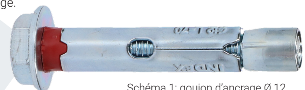
Schéma 1: goujon d'ancrage Ø 12

Si vous souhaitez ranger des objets de valeurs avec une dimension inférieure à 15 mm dans votre coffre-fort, il sera à conseiller de les conserver dans un emballage plus grand, pour avoir plus de sécurité. Ainsi vous éviterez qu'un cambrioleur perce un trou dans le paroi de votre coffre-fort pour voler vos biens avec par exemple un aspirateur.